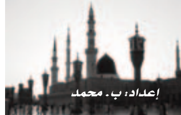
إعداد: ب. محمد

الحمد لله، عن أبي هريرة رضي الله عنه عن النبي صلى الله عليه وسلم قال: «ناركم التي توقدون جزء من سبعين جزءا من نار جهنم» قالوا يا رسول الله: وإن كانت لكافية قال: «فإنها فضلت بتسعة وستين جزءا» الحمد لله، عن أبي هريرة رضي الله عنه عن النبي صلى الله عليه وسلم قال: «ناركم التي توقدون جزء من سبعين جزءا من نار جهنم ولولا أنها أطفئت بالماء مرتين ما كان لأحد فيها منفعة». الحمد لله، عن أبي هريرة رضي الله عنه عن النبي صلى الله عليه وسلم قال: «ناركم التي توقدون جزء من سبعين جزءا من نار جهنم ولولا أنها أطفئت بالماء مرتين ما كان لأحد فيها منفعة».