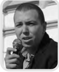
بقلم: الدكتور أحمد وادي جامعة الجزائر 3

عضو الاتحاد الوطني للدكاترة والباحثين الجزائريين