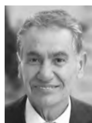
بقلم جلال محمد حسين نشوان

دولة الكيان العاصب، وما تلا ذلك من إجراءات تصعيدية على أرض الواقع تهدف إلى ترسيخ السيطرة اليهودية في القدس الشرقية، في سياق سياسة التهجير القسري وإخلاء المدينة من سكانها الأصليين.