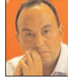
بقلم: حسين مجدوي

كما ركزت «ناسا» على الجانب الديني باستدعائها مجموعة من رجال الدين لكي يقدموا تصوراتهم في حالة ما إذا زارت حضارات فضائية هذا الكوكب. وأخذ هذا الموضوع قوته خلال الثلاث سنوات الأخيرة بسبب شهادات ريبانة الطائرات المقاتلة التابعين للبحرية الأمريكية، إذ أكد أكثر من ربان صعوبة