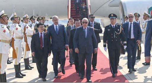
العدادرة لشعبة الرياضيات وشعبة الآداب في ذيل الترتيب

الجزائر تسعى لتسج علاقات قوية ومتينة مع كل الدول .. دولي لـ الموعد اليومي، زيارة الرئيس للصين تأتي في ظرف مهم وستتوج بالتوقيع على عدة اتفاقيات