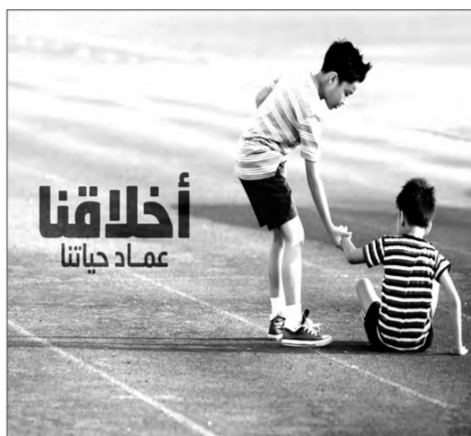
أخلاقنا عماد حياتنا