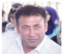
بقلم: سامي إبراهيم هودة

فما أنا بصدده اليوم هو تسليط الضوء على رجال أشداء صابرين على الشدائد والبلاء. رسموا بأوجاعهم ومعاناتهم والأهم طريق المجد والحرية واقفين وقوف أشجار الزيتون وشمخين شموخ جبال فلسطين. صابرين صبر سيدنا أيوب في سجنهم، فهمها غيبهم غيايب سجون الاحتلال الصهيوني وظلمة الزنازين عن عيوننا. فلن تغيب أزواجهم الطاهرة التي تسكن أرواحنا فهم حاضرون بأفئدتنا وإيماننا وعقولنا وفي مجرى الدم في عروقنا مهما طال الزمن أم قصر. عندما نتحضر صور هؤلاء الأبطال البواسل جنرالات الصبر والممود ونستذكر أسمائهم المنقوشة في قلوبنا والراسخة في عقولنا ووجداننا لا نستطيع إلا أن نقف إجلالاً وإكباراً لهؤلاء الأبطال الذين ضحوا بأجلهم سنين عمرهم ليعيش أفراد شعبيهم كباقي شعوب الأرض في عزة وحرية وكرامة. فإسرانا تاج الشخار وفخر الأمة هم من قهروا الاحتلال الصهيوني بممودهم وشبائهم، وأمام عظمتهم أخوتنا المجددات رفاق دربي الصامدين الأسر، أعزائي القراء أحبتي الأفاضل عظم شأنه أن يوافيهم ولو جزئه بسيط