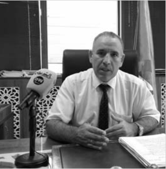
الجرمان من الاعفاء من الغرامات والزيادات.

قائلا أن الخطوة التي قام بها رئيس الجمهورية والمتعلقة برفع قيمة منحة التقاعد التي كانت تتلقا من 3000 دينار فما فوق إلى 20 ألف دينار، قرار غير مسبوق مكن من تحسين المستوى المعيشي للمشتركين المتقاعدين. وفي إطار الأيام الإعلامية التي تنظمها المديرية العامة لـ كاسنوس، تناول المدير الولائي في حوار مع قناة الديوان جملة التسهيلات الاستثنائية، اعتبارا من تمكين جميع المشتركين من حق الدفع بالتقسيط سنوات اشترآكهم وخاصة السنة الحالية بالاستفادة من ذلك عبر 4 أقساط، قائلا في الشأن أن الامتياز الأكبر يخص من لم يدفعوا الاشتراكات قبل تاريخ 30 جوان الماضي، والذين لهم حق الاستفادة من الدفع بالتقسيط رغم تأخرهم، وبالتالي وقف الغرامات والاستفادة من الدفع بالتقسيط الى غاية 31 ديسمبر 2023 وتفعيل بطاقة الشفاء، وكذلك الأمر بالنسبة للذين لم يحترموا الجدولة خلال السنوات الماضية، بعدم قيامهم بالدفع وفقا لها، حيث يقدم لهم الصندوق – يقول السيد بوهلالة – إمكانية إعادة الجدولة عن السنوات السابقة وبالتالي الاستفادة من عدم