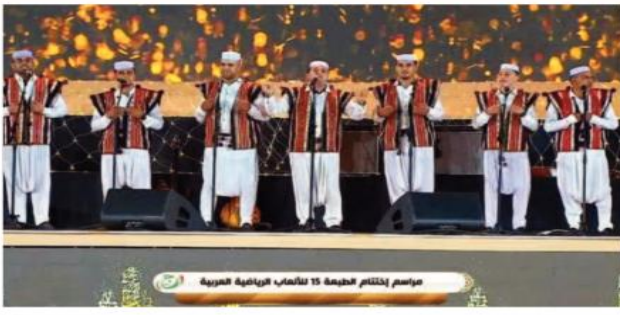
موسم الختام لخمسة 15 للألعاب الرياضية العربية

أسدل الستار سهرة أول أمس على فعاليات الألعاب الرياضية العربية في طبعتها الخامسة عشر، بملعب 05 جويلية الأولمبي مركب، محمد بوضياف، بالعاصمة، وذلك بعد عشرة أيام من التنافس الرياضي بين الرياضيين المشاركين بشعار المتناصفة السليمة والأخوة والصداقة بين الشباب العربي.