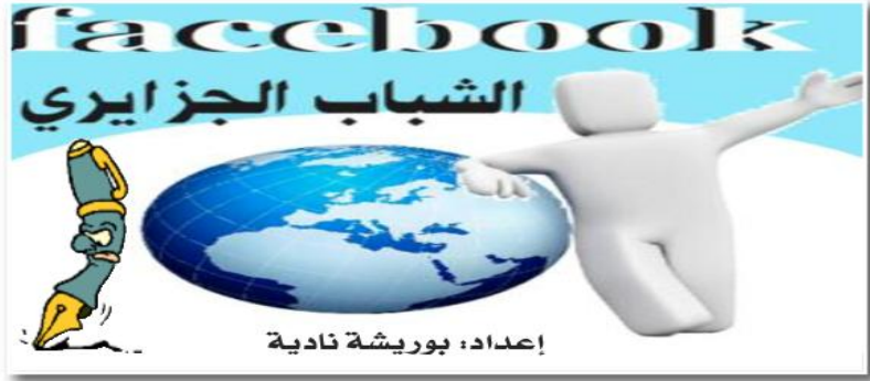
إعداد: بوريشة نادية