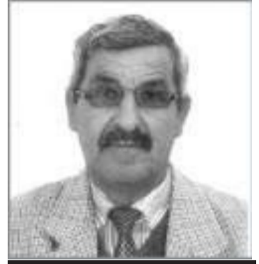
بقلم / قدوده مبارك

تشرق الشمس لأجله كل صباح. وإذا كانت جعافل الطحيان وعلى رأسها عصابة الفساد والخونة والحركة الناقمين على جيل الاستعمار وقد وجدت لنفسها ثوبا في جدار الوطن في فترة من فترات تمارس من خلالها جرائم الانتقام والحقد الأعمى على أبناء الشعب فإن المواطنين المخلصين الذين وضعوا ثورة نوفمبر والذين ترعرعوا في حمى أنجازاتها من الشباب الوفي لعهد الوطن والشهداء والذين يذكرون حجم التضحيات التي بذلها الأجداد لدر كيد العدو كل القدرة على سد المنافذ أمام شرذم الحاقدين وقلع جذورهم مهما كلف ذلك من ثمن.