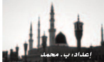
إعداد: ب. محمد

دخل النبي صلى الله عليه وسلم المسجد فوجد رجلاً من أصحابه عليه علامات الهم والغم فقال له صلوات الله وسلامه عليه «يا أبا أمامة ما الذي أجلسك في المسجد في هذه الساعة؟» قال: يا رسول الله، هموم أصابني وديون غلبتني فقال له النبي صلى الله عليه وسلم: «ألا أعلمك كلمات إذا قلتهن أذهب الله همك وقضى دينك؟» قال قلت: بلى يا رسول الله، قال: «قل إذا أصبحت وإذا أمسيت اللهم إني أعوذ بك من الهم والحزن، وأعوذ بك من العجز والكسل، وأعوذ بك من الجبن والبخل، وأعوذ بك من غلبة الدين وقهر الرجال.» قال فقلتهن فأذهب الله همي وقضى ديني» رواه أبو داود عن أبي سعيد الخدري رضي الله عنه. اقنعوا بالحلال عن الحرام، وتوبوا إلى الله من المظالم والآثام، وأحسوا كما أحسن الله إليكم، ويسروا على عباد الله إن يسر الله إليكم، واجعلوا أموالكم حجاً لكم من