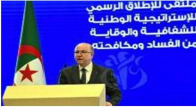
ملحق للإطلاق الرسمي للإستراتيجية الوطنية للشفافية والوقاية من الفساد ومكافحته

الوزير الأول، السيد أمين بن عبد الرحمان رئيس الجمهورية يولى عناية كبيرة لمحاربة الفساد وبناء جوائز جديدة قوامها الحق والقانون