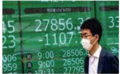
عكس المؤشر نيكاي مساره ليغلق على انخفاض اليوم الجمعة بسبب توجي الخلل قبل اجتماع السياسة النقدية للبنك المركزي الياباني، في حين دفع ارتفاع الين مقابل الدولار للمستثمرين إلى بيع الأسهم. وانخفض المؤشر نيكاي 0.09٪ إلى 22391.26 نقطة عند الإغلاق متراجعا عن فقرة بنسبة 1٪ في وقت سابق من

الجلسة. وظل المؤشر مستقرا خلال الأسبوع. كما عكس المؤشر توكيوكس الأوسع نطاقا مساره وتراجع 0.17٪ إلى 2239.10 نقطة وخسر 0.7٪ خلال الأسبوع. ومن المقرر أن يعقد بنك اليابان اجتماعه للسياسة النقدية يومي 27 و28 يوليو/توز. وأدت التكهينات بأن البنك المركزي سيعدل سياسته شديدة التيسير إلى ارتفاع عوائد السندات الحكومية اليابانية لأجل عشر سنوات اليوم الجمعة إلى أعلى مستوى لها في أربعة أشهر ونصف الشهر. وفي الوقت نفسه، ارتفع الين ليلاص أعلى مستوى في شهرين عند 137.245 للدولار في وقت سابق من الجلسة، وهو في طريقه لتسجيل أفضل أداء له في أسبوع مقابل الدولار منذ يناير/كانون الثاني، بينما حام الدولار حول أدنى مستوياته أمام العملة اليابانية في 15 شهرا. وعكس سهم فاست ريتيليس المالك للعلامة التجارية يونيكو مساره وانخفض 0.09٪، كما كان له أكبر أثر على المؤشر نيكاي. وكان من المتوقع في البداية أن يعزز السهم مكاسبه التي حققها أمس الخميس عندما أعلنت الشركة عن أرباح قياسية في الربع الثالث ورفعت توقعاتها للعام بأكمله. وحسر سهم بنك غروب 0.2٪. وحدت مكاسب أسهم الشركات المرتبطة بالترائح من تراجع المؤشر نيكاي بعد أن قفز سهم أدفانتست لتصبح معدات اختيار الرقائق 5.74٪، ورجع سهم شركة طوكيو إلكترون لصناعة معدات تصنيع الرقائق 1.76٪.