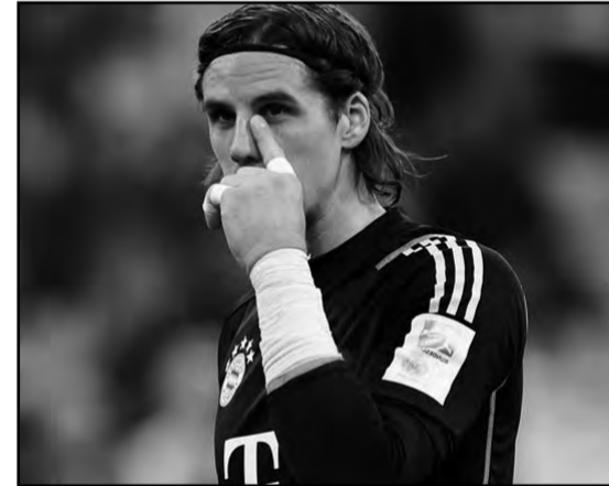
حسم السويسري يان سومير، حارس مرمى بايرن

ميونخ، موقفه من عرض إنتر ميلان لضمه خلال فترة الانتقالات الصيفية الجارية. وساد الغموض حول مصير سومير هذا الصيف، في ظل احتمالية خسارة مركزه بتشكيلة الفريق البافاري، نظراً لقرب عودة مانويل نوير للملاعب، بعد الإصابة التي لحقت به مع نهاية