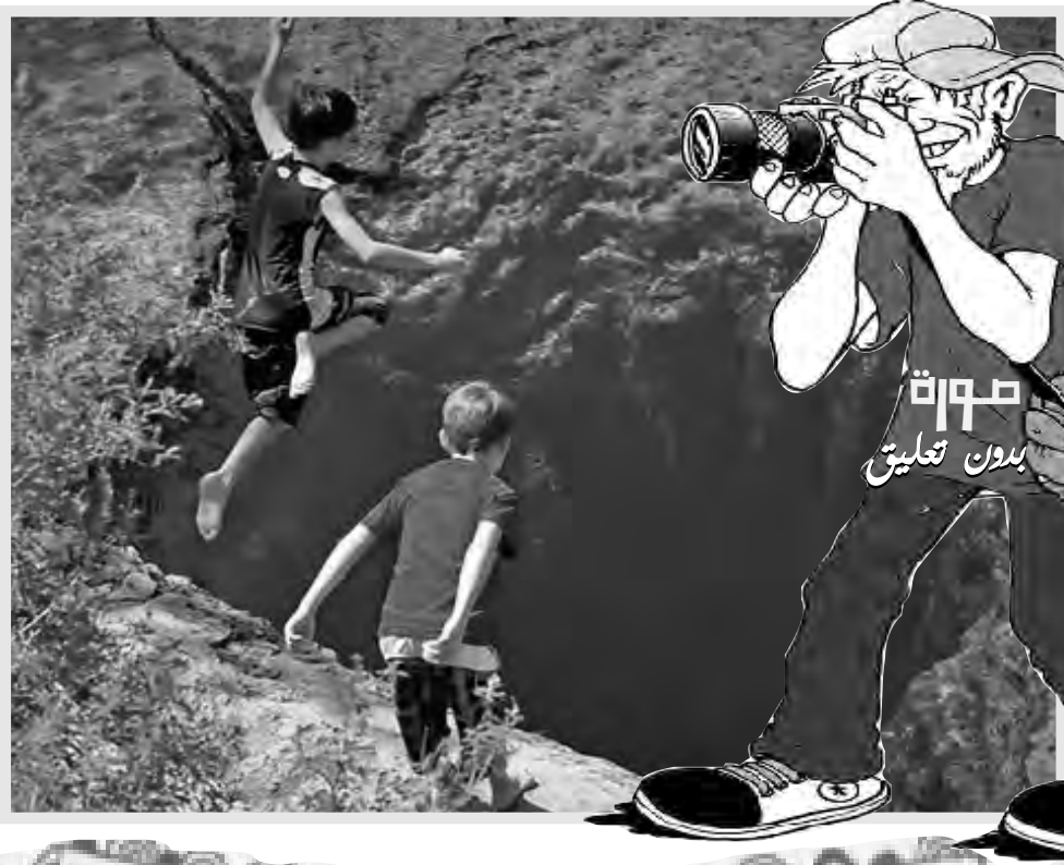
صورة بدون تعليق

أطلقت وكالة الفضاء الهندية صاروخا يحمل مركبة فضاء إلى المدار قبل تنفيذ هبوط مزروع الشهر المقبل عند القطب الجنوبي للقمر. وبعد ست عشرة دقيقة من إطلاق منظومة أبحاث الفضاء الهندية الصاروخ أعلن طاقم التحكم أن الصاروخ نجح في وضع مركبة الهبوط تشاندريان-3 في مدار حول الأرض، مشيرة إلى أنها ستنتج تنفيذ هبوط على القمر في الشهر المقبل. وإذا نجحت المهمة ستضم الهند إلى مجموعة من ثلاثة بلدان نجحت في تنفيذ مهمات هبوط على سطح القمر هي الولايات المتحدة وروسيا والصين.