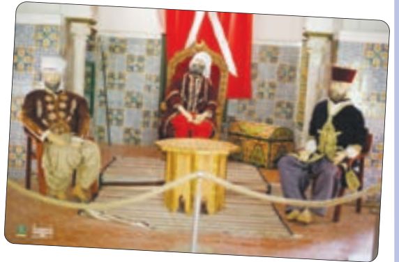
محمود بن شعبان

أن يكتشف ضيوف مدينة سيرا خلال المهرجان الثقافي الدولي للمالوف تراث قسنطينة والجزائر الكثير من خلال المعارض المتنوعة، فبالإضافة إلى معرض اللباس التقليدي الذي احتضنه قصر أحمد باي، احتضنت قاعة "الزيتيت" عبر مختلف أجنحة المعرض عدة محطات لتسويق التراث الجزائري في الكثير من المجالات، على غرار معرض لفن الطبخ ومعرض للحلويات القسنطينية، وآخر لفن التقطار ومعرض الصور والآلات الموسيقية الخاصة بفن المالوف بالتسويق مع غرفة الصناعة التقليدية ومديرية السياحة فنجحت تلك المعارض في استقطاب الضيوف الأجانب المشاركين في المهرجان على غرار تونس، ليبيا، إيطاليا، لبنان وتركيا، الذين استفادوا من زيارات ميدانية إلى مختلف المعالم التاريخية والمتاحف والمعارض، التي أبهرت الحضور بغنى وتنوع الثقافة والتراث الجزائريين وكذا البناء المعماري الذي تزخر به مدينة قسنطينة.