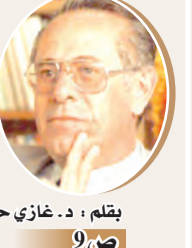
بقلم: د. غازي حسين

كي لا تنسى النكبة والإرهاب والإبادة توحش الجيش الصهيوني في مجزرة الدوايمة