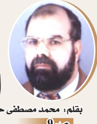
بقلم: محمد مصطفى حابس

نصاف قرن من العمل الإسلامي على كل الجبهات