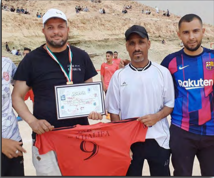
المنطقة نظرا للتأثير الكبير للرياضة في مسار المجتمعات، مُتمنيا أن تتخذ السلطات المحلية المزيد من الإجراءات بما يتماشى مع نهجها في الارتقاء بالواقع المحلي.

تظاهرة "معا حتى النهاية" بقبر الصّحبي بالجلفة