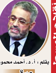
بقلم: أ. د. أحمد محمود عيساوي