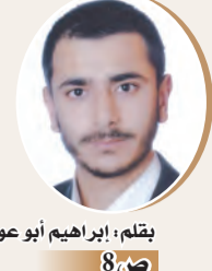
بقلم: إبراهيم أبو عواد

نصاف قرن من العمل الإسلامي على كل الجبهات