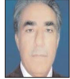
بقلم: مزه جبر الساعدي

الخارجية الأمريكية قالت في تعليقها على العملية الإسرائيلية في جنين؛ إن هذا العنف يكشف أهمية التعاون الأمني بين الاستخبارات الإسرائيلية والفلسطينية. البيت الأبيض هو الآخر قال في تعليقه على عملية إسرائيل في مخيم جنين المنهجية والمرسومة خططها وأهدافها سلفاً في تصفية خلايا المقاومة، وهذا هو ما كشفت عنه إسرائيل التي قالت عنها إنها وضعت خططها منذ أكثر من سنة؛ إن من حق إسرائيل الدفاع عن أمنها. السلطة الفلسطينية في ردها على هذا الاجتياح والقتل الممنهج والهادف للفلسطينيين؛ قالت إنها أوقفت التعاون والتنسيق الأمني بينها وبين سلطات الأمن الإسرائيلية، هذا التعليق أو إيقاف التعاون والتنسيق الأمني بينها وبين الأمن الإسرائيلي، لم يكن الأول ولن يكون الأخير. إذ بعد كل عملية يقوم بها الاحتلال بالقتل وتهديم المنازل تلجأ السلطة الفلسطينية إلى هذا الإجراء وهو إجراء وقتي غير فعال أبداً، والاحتلال الإسرائيلي ومعه أمريكا يدركان ما يعنيه الإيقاف الوقتي للتنسيق