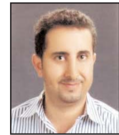
بقلم: خالد وليد محمود

فمنذ عام 2012، ارتفع معدل الحوادث والخلافات المتعلقة بالذكاء الاصطناعي 26 مرة وتعمق هذه الظفرة اعتماداً أكبر لتقنيات الذكاء الاصطناعي وفهماً متزايداً لإمكانية إساءة استخدامها كما بلغ الاستثمار الخاص في الذكاء