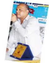
بفن الصا... إنه الإنسان الذي لا يعرف المروعة والعدالة لكل الناس...

إن القصة القصيرة جدا لتتأبر اليوم لأشبات شرعية وجودها، وذلك عبر ما يطرحة كتابها من نماذج فنية، يجتهدون في إنتاجها مشمولة بفتيات وتناول مختلف، حتى تصير نوعا ادنيا يسير إلى غاية، تستند فيها إلى معيار جودة الكتابة كضابط للأثر. ويسعى الكاتب السعودي حسن البطران عبر ما ينتجه من قصص قصيرة جدا، إلى جعلها نوعا أصيلا متفردا، ومستقلا عن الأنواع الأخرى، رغم ما يتيح لها الإندراج تحت مظلة النثر الحكائي؛ فتأتي قصته القصيرة (ستارة بلون رمادي) المنشورة في العدد (411) من الجريدة الجزائرية (كواليس الجديدة) بتاريخ الأربعاء 18 ذو القعدة 1444 الموافق 7 / 6 / 2023 متميزة باستقلاليته كنوع أدبي مستقل، تتوافقه جودة الكتابة وعناصر القصة القصيرة جدا.. فنراه وظفنا الفعل بهارة لتسييد ما ضويع الحدث، حتى وإن أتى بأفعال مضارعة فينظي عنها مضارعتها؛ لتتمنح معنى ماضويا أيضا؛ مثل (لم تسعفه)؛ وذلك