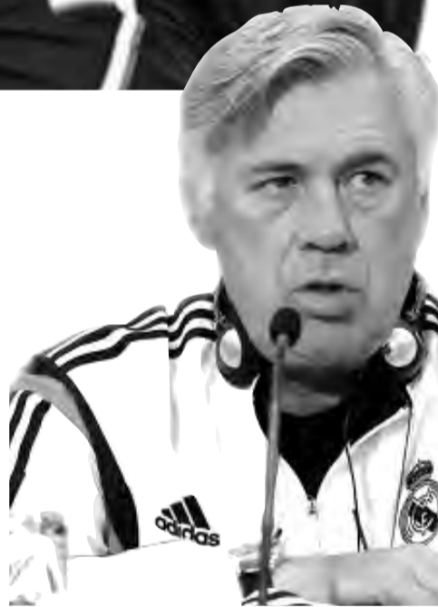
مورينيو سيواصل اللعب بثلاثة مدافعين

أكد المدرب أردا توران أن اللاعب أردا غولر المنتقل حديثاً إلى ريال مدريد الإسباني، سيكون أفضل لاعب في تاريخ كرة القدم التركية. وصرح توران قائلاً: "أردا غولر لاعب ذو قيمة للغاية وثمين وذو قيمة، سوف يقودنا إلى الأمام". وأضاف: "أعتقد أنه سيكون أعظم ممثلينا، ربما سيكون أهم لاعب في تاريخ كرة القدم التركية، لهذا صلواتنا معه، نحن فخورون ومتحمسون جداً، سيكون في الميدان في أقرب وقت ممكن". واختتم: "نحن سعداء بانتقاله إلى ريال مدريد، وسنقول له حظاً سعيداً وسوف نصلي من أجله".