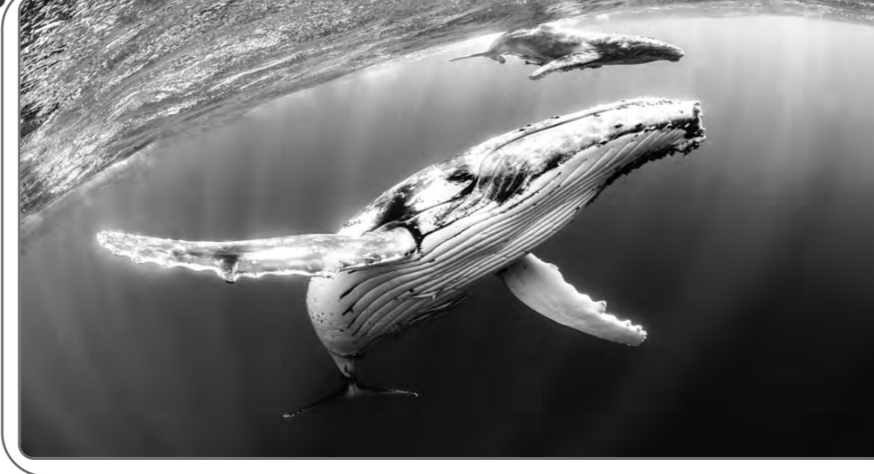
من مقالات الباحث عبد الدائم كحيل

المسجد الأقصى ثاني مسجد وضع في الأرض؛ هو ثاني المساجد في الأرض بعد المسجد الحرام؛ قال: سمعت أبا ذر رضي الله عنه، قال: قلت يا رسول الله، أي مسجد وضع في الأرض أول؟ قال: "المسجد الحرام"، قال: قلت: ثم أي؟ قال: "المسجد الأقصى"، قلت: كم كان بينهما؟ قال: "أربعون سنة، وأينما أدر كنت الصلاة فصل، فهو مسجد" رواه البخاري. وقد ذكر بعض أهل العلم أن آدم عليه السلام كان هو الذي وضع أساس المسجد الحرام والأقصى، وأن بناء إبراهيم عليه السلام للمسجد الحرام، وبناء سليمان عليه السلام للمسجد الأقصى كان بناءً تجديد لا