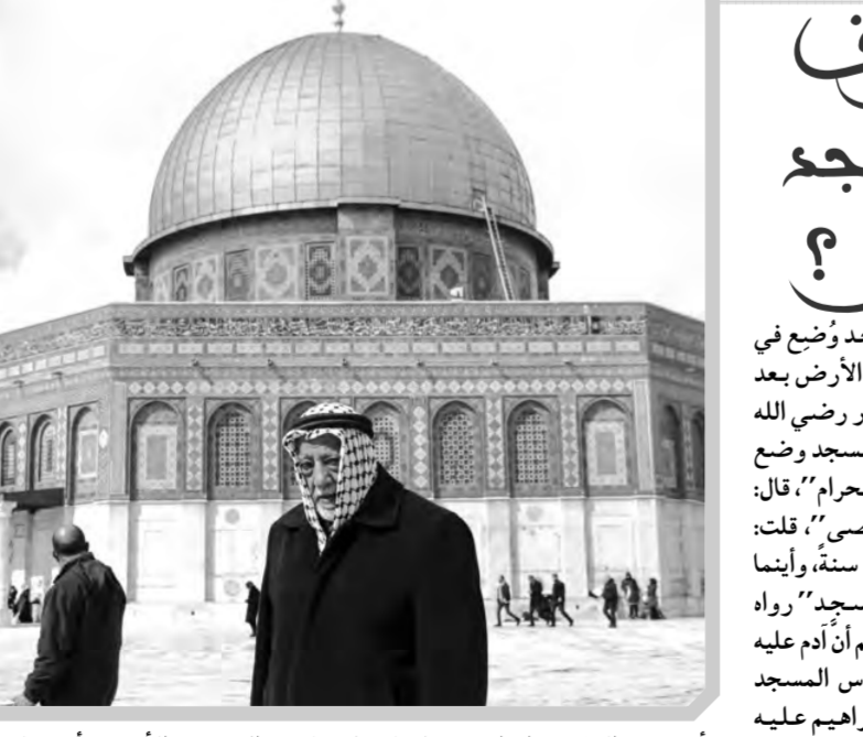
المسجد الأقصى أحد ثلاثة مساجد إليها تُشدُّ الرجال: أجمع أهل العلم على استحباب

اللهم اني عبدك ابن عبدك ابن أمك ناصيتي بيدك، ماض في حكمك، عدل في قضاؤك، أسألك بكل اسم هو لك سميت به نفسك أو أنزلته في كتابك، أو علمته أحدا من خلقك أو استأثرت به في علم الغيب عندك أن تجعل القرآن ربيع قلبي، ونور صدري، وجلاء حزني وذهاب همي، والعجز اللهم اني أعوذ بك من الهم والحزن، والعجز والكسل والبخل والجبن، وضلع الدين وغلبة الرجال.