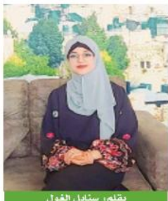
بثلم: سنايل الغول

واقفاً يعيشه الفلسطيني ويتجرع مراته منذ عشرات السنين ضريبة تسكك بأرضه. ففي داخل التوايت الحجرية عشرات الفلسطينيين منفيين خلف قضبان الزنازين مجهولي المصير يستصرخون بين مطالب الاعتقال الإداري التعسفي الذي ينتهجه الاحتلال الإسرائيلي بحق أبناء الشعب الفلسطيني والذي يعد إجراء قانونياً غير مقبول به قطعاً كونه انتهاكاً صارخاً لمعايير حقوق الإنسان.. وقد عرفت المنظمات الحقوقية الاعتقال الإداري بأنه اعتقال بدون تهمة أو محاكمة، يعتمد على ملف سري وأدلة سرية لا يمكن للمعتقل أو محاميه الاطلاع عليها، ويمكن حسب الأوامر العسكرية الإسرائيلية تجديد أمر الاعتقال الإداري مرات غير محدودة، حيث يتم استصدار أمر اعتقال إداري لثلاثة أعوام ستة شهور قابلة للتجديد... (الأسرى- مركز المعلومات الفلسطيني- وفا) لقد اعتادت دولة الاحتلال على ضرب القوانين الدولية