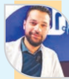
■ زكرياء حوشين

وينصح المختص المصابين بقصور في الغدة الدرقية، والذين يتناولون دواء الهيدروكورتيزون، بمضاعفة الجرعة في هذا الحر