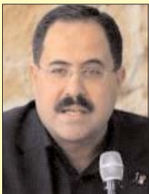
■ بقلم: صبري صيدم

هكذا وبلمحظة واحدة انتهى شهر العسل، أو بالأحرى سنوات العسل التي عاشها العمالقة في ما بينهم ليس حيا بعضهم بعضا، بل رغبة منهم في السيطرة على أموال الشعوب، بهدوء وحكمة قائمنة على المناقشة بعيدا عن الصخب، والتسابق بعيدا عن الضوضاء، وتوزيع الغنائم بعيدا عن الأنظار. كلهم سبوحوا بظك المال والفضاء التقني، وكلهم تسابقوا على معلوماتنا فباعوها، وعلى خصوصياتنا فاجتاحوها، وعلى أموالنا فاخذوها، لتنتم معظم هذه الأمور، برضانا وورغبتنا. إلا أن استحقاق الطمع والجشع وحب المال، قد قوض دبلوماسيته الناز السابفة، وهندة العمالقة المتناكدة، وصولا إلى اختراق جدار الهدوء المشوب بالاحذر بخطوة هزت عالم المال والأعمال.