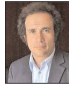
■ بقلم: عمرو حمزاوي

فاليوم، ترتكز أجندة اليمين المتطرف في ألمانيا إلى خطابين للكراهية، كراهية الغريب وكراهية أوروبا. أما كراهية الغريب فتتجه إلى مئات الآلاف من اللاجئين الذين وفدوا ألمانيا خلال السنوات الماضية وملايين المقيمين ذوي الأصول الأجنبية، وتروج بين الناس للخوف منهم على الرخاء الاقتصادي والسلام الاجتماعي والنظام العلماني والهوية الحضارية