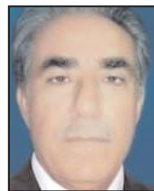
■ بقلم: مزه جبر الساعدي

تحاول الولايات المتحدة الأمريكية؛ بث الدفء في علاقتها مع الصين، التي شهدت في الفترة الأخيرة برودة اعترافها الكثير من المطبات. وزير خارجية الصين وصف تلك العلاقة بأنها هي الأدنى مستوى؛ كان هدفها، هو تجسير منطقة انقطع إلى حد ما الاتصال المباشر بين الدولتين وشابها الكثير من الغموض وعدم الثقة. زيارة وزير خارجية الولايات المتحدة الأخيرة للصين؛ كان هدفها، هو تجسير منطقة الفراغ بين الدولتين، وتأمين الاتصال والتواصل بينهما، لدرء أي سوء فهم، وأي خطأ في تقدير الموقف من قبل الطرفين، وأيضا محاولة أمريكا إبعاد الصين ولو بدرجة ما عن روسيا. مما يلفت الانتباه أنه ما أن انتهت زيارة الوزير الأمريكي للصين، إلا ووصف الرئيس الأمريكي في تصريح له مؤخرا؛ مثيله الصيني بالديكتاتور. لم تتأخر الخارجية الصينية في الرد على الرئيس الأمريكي، على لسان المنطقة باسمها؛ التي قالت فيه؛ إن قول الرئيس الأمريكي هذا، استفزاز متعمد وإهانة للكرامة الصينية. إن كلا الدولتين لا يمكنهما أن تتشا سياسة كل منهما اتجاه الأخرى، بطريقة متبادلة؛ لأن أهدافهما وخططهما مختلفة جدا، إنما من الجهة الثانية ليس أمهما، على الأقل في الأمد المنظور إلا إيجاد منطقة تفاهم مشتركة في حدودها الدنيا؛ التي بها تمنعان أي سوء فهم من الاستمرار والتوسع والترام؛ الذي إن استمر