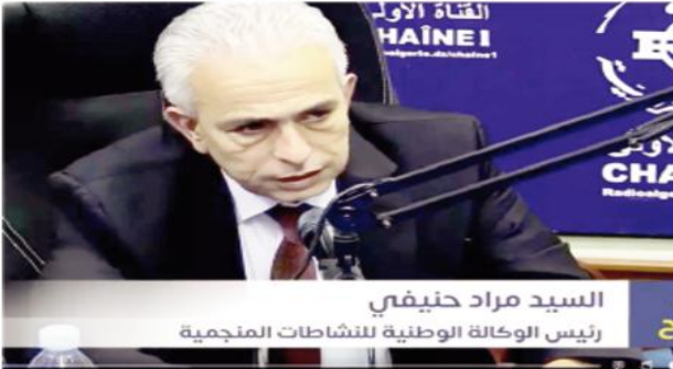
السيد مراد حنيفي رئيس الوكالة الوطنية للنشاطات المنجمية

كشف رئيس الوكالة الوطنية للنشاطات المنجمية بوزارة الطاقة والمناجم مراد حنيفي عن الانتهاء من إعداد قانون المناجم الذي سيفتح المجال للمستثمرين ويرفع كل المراقيل البيروقراطية والمالية. موضحا أن هذا القانون متواجد على مستوى الأمانة العامة للحكومة حيث سيتم عرضه على المجلس الشعبي الوطني قبل نهاية السنة الجارية .