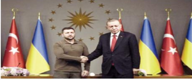
زعما "الناتو" يجتمعون على ابواب روسيا

ونقلت وكالة "تاس" الروسية للأنباء، من بوندارييف قوله إن "الأحداث التي شهدتها الأسابيع الماضية، للأسف، تظهر بوضوح أن تركيا مستمرة بشكل تدريجي وثابت في التحول من دولة محايدة إلى دولة غير صديقة لأنها اتخذت سلسلة من القرارات الاستفزازية" بعد زيارة الرئيس الأوكراني فولوديمير زيلينسكي لتركيا يوم الجمعة.