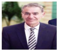
بقلم / جلال محمد حسين تشوان

تعد تميز العلاقة الفلسطينية الجزائرية بعلاقة توأمة الروح فالشعبيين شعبين إنهما الشعبين الفلسطيني والجزائري الذين أثاروا الكثير من التساؤلات وعلامات التعجب والاستهزام على سر الود والحب والتلاحم بينهما. أخوة الدين، العرق، حيث تعتبر العلاقة الفلسطينية الجزائرية من أمث العلاقات، والمتتبع سيجد أن هذه العلاقة ليست وليدة اليوم بل أنها قامت على تراكبات تاريخية بنيت على مشاركة الجزائريين في الحروب الصليبية وفي تحرير بيت القدس من الصليبيين، ويشعور الجزائريين بأنهم معنيون بشكل مباشر بالدفاع عن مقدساتهم كمسلمين، والدفاع أيضا عن حقهم المغتصب في فلسطين المتمثل في حارة المغاربة الجهادية لحناظ البراق التي دمرها اليهود ولأن الشعب الجزائري يعشق النضال والحرية، ولأنه يعي جيدا مساوئ الاستعمار الاستيطاني، كما يعي حقارة اليهود لتجربته المريرة معهم، فإنه يحب حبا فطريا كل من يتاضل ويدافع عن شرف الأمة العربية والإسلامية، وعلى رأس أهل الجهاد والنضال الشعب الجزائري الفلسطيني المقاوم، الذي أخذ على عاتقه قيادة الدفاع عن فلسطين عموما ومقدسات المسلمين فيها