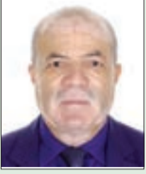
■ د. محمد مزاح

صحيفة "رأي اليوم" الإلكترونية هي المحطة الثانية التي نقل إليها الصحفي الفلسطيني عبد الباري عطوان مساره الإعلامي بعد صحيفة "القدس العربي"، وبقي على النهج الإعلامي نفسه، الذي تمثل فيه "قضية فلسطين" المركز الذي تدور حوله المادة الإعلامية التي تنشر على الموقع استمرارا لمسار "القدس"، على خلفية أيديولوجية قومية عربية، متداخلة مع قيم الشعوب العربية ومقوماتها، وعلى رأسها الإسلام الأطار الحضاري للعالم العربي، والرابط الأنسب للقومية العربية؛ كي تعود لساحة الوجود الحضاري مستلهمة ماضيها المشرف المشرق، مع التحلي بروح الشجاعة الحضارية لمراجعة أخطائها القتالة خلال مسيرها الكبير ضمن الأمة الإسلامية، ودخول العصر من مكتسباته السياسية والعلمية والصناعية والتنظيمية التي نقلت البشر في زمن قياسي إلى نمط حضاري لم يحلم به أحص الناس خيالا لمستقبل الجنس البشري.