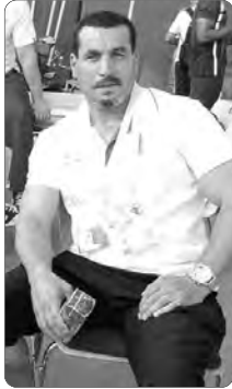
فروجة ن. المبرجة لهذا الموعد، فتوفير بيئة تحضيرية ملائمة تسمح للمقاتلين بالرياضة الجزائرية الحلم بتتويج أولمبي.

وفي وقت سابق من نهار ذات اليوم، تغلبت ليبيا على فلسطين بنتيجة 3 أشواط مقابل صفر (15-25، 10-25 و 19-25)، بينما كان المنتخب القطري معض من هذه الجولة. وعلى ضوء النتائج، تتحتل الجزائر صدارة جدول الترتيب العام برصيد 12 نقاط، متقدمة على ليبيا (6 نقاط)، ثم قطر والأردن (3 نقاط)، في حين تتبدل فلسطين الجدول دون برصيد (0 نقاط)، وخلال الجولات الثلاث الأولى تغلب الفريق الوطني بنسب التنجية على كل من فلسطين وقطر وليبيا (0-3). و- توفيق