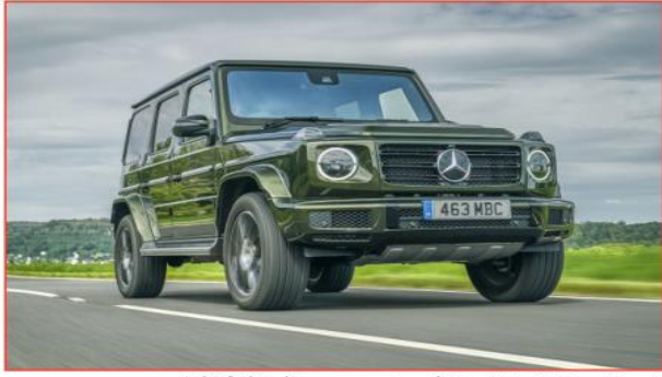
للمجلات، وستوفر للطلب في أوروبا بسعر يبدأ من 1,96,350 يورو.

يمكن اختيار السيارة باللونين الأبيض أو الزيتوني، وتأتي بجنوط خفيفة مقاس 20 بوصة بتصميم يتكون من 5 أذرع مزدوجة، ويتميز هذا الإصدار أيضا بكتابة حروف اسمه «Final Edition» في الخارج وعند عتب الأبواب وفي بعض الأجزاء الداخلية، كما تقوم مرايا الأبواب بإسقاط ضوء لحرف G وعبارة معناها «أقوى من الزمن». وتحتوي المقصورة على نظام صوت Burmester وقرش داخلي من جلد النابا ثنائي اللون، ومجموعة مقاعد Active Multicontour Plus، بالإضافة لبعض اللمسات الحصرية مثل قرش جلد كامل بلون يتناسب مع الطلاء الخارجي للسيارة. أما عن منظومة القوة، فتستمر السيارة بمحرك بترين V8 سعة 4.0 لترًا توربو بولد قوة 421 حصان بنظام دفع كلي