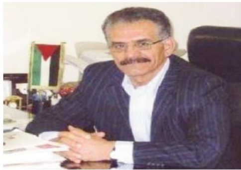
ب.قلم د . عبد الرحيم جاموسي

الجزائر وشالج قوية ومتينة عبر التاريخ ..لا تهزها الأراجيف ولا الأعاصير فهي تركزت على ركائز تاريخية وعقدية واجتماعية واقتصادية ووطنية وسياسية ، فلا يبالغ اذا قلنا ان الجزائر وفلسطين توأمان لا ينفصلان لثلاثة هذة الوشائج والعلاقات التي تربط بين القطرين والشعبين