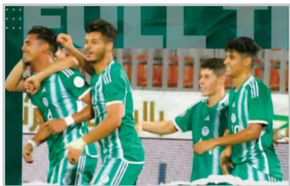
الجزائر-السعودية اليوم بعنابة

كرم الاتحاد العربي للثقافة والرياضة الرئيس الجزائري، عبد المجيد تبون، ممثلا بوزير الشباب والرياضة عبد الرحمن حماد، بلقب الجزائر عاصمة الثقافة العربية لعام 2023، كتقدير لما سخره الرئيس تبون للم الشمل العربي باحتضان الجزائر العديد من الأحداث الرياضية الهامة وإعطائها طابعا ثقافيا متنوعا يعكس الهوية العربية والتي حرصت الجزائر