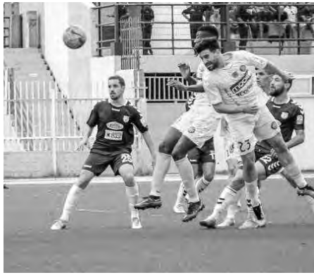
نادي بارادو - إتحاد بسكرة مولودية وهران - شبيبة قسنطينة إتحاد خنشلة - شباب بلوزداد شبيبة القبائل - نجم مقرة هلال شلقوم العيد - أمم الأربعاء

برنامج المباريات إتحاد العاصمة - جمعية الشلف