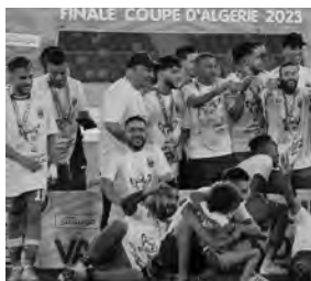
الانتقال إلى ناد آخر.