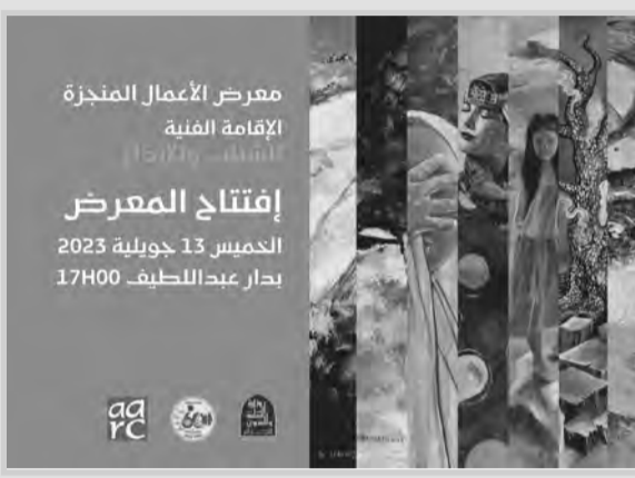
افتتاح معرض الأعمال المنجزة أثناء الإقامة سيكون يوم الخميس 13 جويلية الجاري، بدار عبد اللطيف ابتداء من الساعة الخامسة مساء بحضور جميع الفنانين المشاركين.