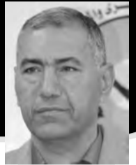
بقلم: عبد الناصر عوني فروانة

حظة تلقي خبر وفاة اللواء قدري أبو بكر، شهقت أنفاسي ولم أصدق - ولا أريد أن أصدق - تنقلت بين المواقع الإخبارية والقلق يتملكني، علّ أحدها ينفي أو حتى يأتي بأهون المصائب "إصابة الوزير اللواء قدري أبو بكر!!". وأجريت اتصالاً واثنين وثلاثة، وتواصلت مع زملائي في هيئة شؤون الأسرى والمحررين، فجات الأبناء الباتسة: "أبو فادي مات بالفعل ورحل إلى الأبد". يا الله ما أقسى الموت، حينما تفقد إنساناً عزيزاً، فهذا ليس بحادث عادي أو موت عابر، إنها الفاجعة. فاجعة إنسانية وطنية أصابتنا جميعاً بالصدمة، وما زلنا نعيش اضطرابات ما بعد الصدمة. وكما يقول الشاعر الفلسطيني محمود درويش: الموت لا يوجع الموتى.. الموت يوجع الأحياء. عرفناه ثائراً أفتحوا باباً ومقاتلاً فلسطينياً وأسيراً وطنياً متمرداً على كل أشكال الظلم والقهر، ورمزاً من رموز الحركة الأسيرة، طوال سنوات سجنه التي امتدت لنحو سبعة عشر عاماً متتالية. عرفناه رجلاً صادقاً وقائداً وحدوياً وإنساناً متواضعاً، في كل الميادين، فحفظنا صورته في القلوب، وحفرنا اسمه في العقول، وسرّدد معاً اسمه دوماً بين الجموع. فما من أحد عرفه أو التقى به، إلا وأثنى على حسن سيرته وطنية قلبه. وما من أحد من هؤلاء سمع بخبر وفاته إلا وتوشح الحزن ألماً لفراقه، واسترسل بذكر محاسنه، وهذا ما سمعناه وقرأناه في حياته وبعد مماته.