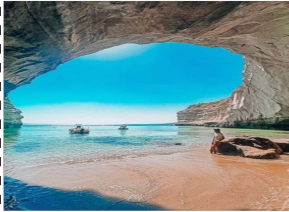
منظر ولا أروع من شاطئ القيتار بعين تموشنت...