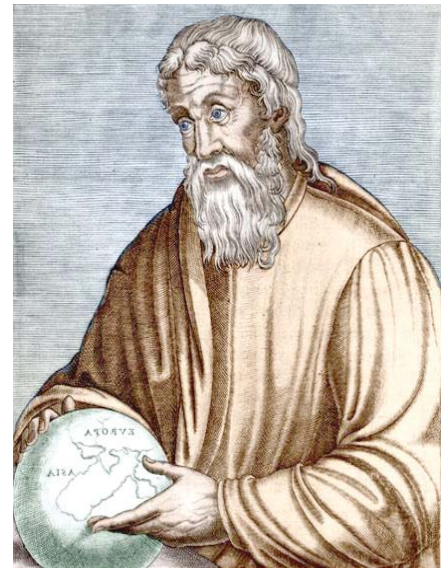
المؤرّخ والجغرافي الإغريقي "سترابون"

تعود الشواهد الرومانية حول صيد الحيوانات البرية، مثل الأسود والفهود على الخصوص، إلى القرون الميلادية الأولى، لا سيما القرن الرابع. ورغم ما أعقب ذلك الزمن من أحقاب تاريخية أخرى، يُفترض أن عمليات الصيد لم تتوقف فيها، فإن الحيوانات البرية المُفترسة بشكل خاص، لم تتعرض إلى خطر الانقراض، وظلّت الحياة البرية في الجزائر