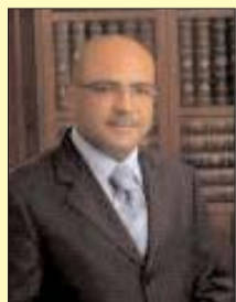
بقلم: رمزي الغزوي

أسرُّ لي صديق كاتب بأنه يخاف على مكتبته العريقة التي جمعها على مدار ستين سنة وأكثر. يخشى أن تذهب هذه النفائس خردة أو يزالها على جوانب الحاويات. وأسر بأنه ندم أن صرف جل عمره في القراءة والتأليف والبحث وأخذ الحياة على محمل الجد. ويسألني بحزن: ماذا قدمت لي مؤلفاتي؟ إنها حتى لم تطعمني خبزاً أو بصلاً.