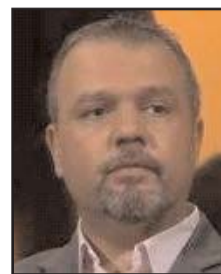
بقلم: خالد بن سلطان السيد

ومع تعاضم شعبية اللعبة لدى السيدات، ووجودهن بين روابط المشجعين وفي ادارات الأندية من الأجهزة الطبية والفنية والإدارية، صار لهن صيت بين المحللين والمذيعين، بالإضافة إلى دورهن في عالم