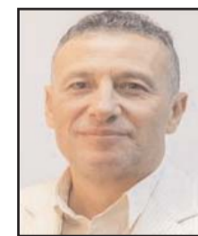
بقلم: إسماعيل الشريف

8- كل من ينكر قوانين وسياسات الفصل العنصري ضد الشعب الفلسطيني؛ كقانون الدولة القومية، أو قانون لم شامل الأزواج.