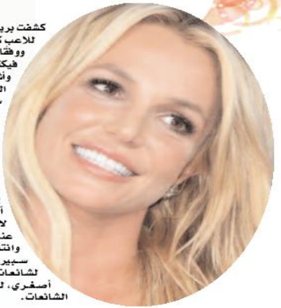
سبيرز قد تعرضت مؤخرا لشناعات حول انفصالها عن سام أصغري، لكن الزوج قام بنفي هذه الشناعات.

كشفت بريتي سبيرز، نجمة موسيقى البوب الأمريكية، عن تعرضها للاعتداء من قبل الحرس الخاص للاعب كرة السلة الفرنسي بالدوري الأمريكي للمحترفين فيكتور ويمبانيا، البالغ من العمر 19 عاما. ووفقا للتفاصيل المتداولة، تلقت بريتي ضربة في لاس فيغاس من أحد عناصر الفريق الأمني للاعب فيكتور ويمبانيا، مما حملها على التقدم بشكوى في شأن هذا الحادث. وأشارت بعض التقارير إلى أن تفاصيل الواقعة ترجع إلى دخول بريتي إلى مطعم داخل أحد الفنادق مع زوجها سام أصغري، وأحد أفراد فريقها الأمني، وعندما رأت بريتي لاعب كرة السلة سارت تجاهه ونقرت على ظهره لطلب صورة، لكن الحرس الخاص به هاجمها واستدار محاولا دفعها بعيدا عنه وضربها على وجهها، وخلع نظارتها. وأوضحت المغنية على حسابها عبر موقع تبادول الصور والمقاطع المصورة، إنستغرام، أنها رأت مساء الأربعاء عند مدخل مطعم أحد الفنادق اللاعب الفرنسي الموجود حاليا في نيفادا لخوض أول مباراة له مع فريق سان أنتونيو سبيرز. وأضافت المغنية، «قررت التحدث إليه وتهنئته على نجاحه. ونظرا لشدة الضوضاء، نقرت على كتفه لجذب انتباهه، فما كان من عنصر في جهاز أمنه إلا أن سفعني من دون أن ينظر إلى الوراء..» وكتبت أيضا: «يلاحقني الناس باستمرار، لكن فريق الأمن لم يضرب أيا منهم.. مشيرة إلى أن الضربة كانت أن تطيحها أرضا وأدت إلى انتزاع نظارتها عن وجهها. من ناحيته، أكد فيكتور ويمبانيا حدوث الحادث، مشيرا إلى أنه لم يعرف بأن سبيرز هي المغنية إلا لاحقا. يذكر أن بريتي سبيرز قد ولدت في عام 1981 بأمريكا، وبدأت مشوارها الفني عندما أطلقت ألبومها أول وهي في الثامنة عشر من عمرها، وهو الألبوم الذي حقق نجاحا وانتشارا كبيرا جدا، وتولت بعدها ألبوماتها. كانت بريتي