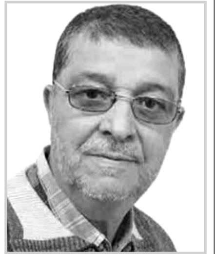
بقلم قرار المسعود

- في ما سبق تم غلق ما يقرب 1200 شركة عامة وبيعها باحجان تحت غطاء التخصخصة حتى لبعض الأجانب الذين حوّلوا تلك الشركات التي صنعت مجد الصناعة الوطنية إلى مستودعات لنفس المواد تستورد من الخارج بالعملة الصعبة الوطنية التي