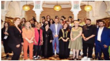
وكذا ممثلين عن المجلس الأعلى للشباب.

استقبل أمس وزير الشباب والرياضة عبد الرحمان حماد رئيس اللجنة الأولمبية الفلسطينية اللواء جبريل الرجوب الذي قدم تهانيه للجزائر بمناسبة نجاح تنظيم الطمعة الخامسة عشر للألعاب العربية خاصة حفل الافتتاح الذي أهر الجميع كما كان هذا اللقاء فرصة لتبادل أطراف الحديث حول مسألة العلاقة التاريخية التي تربط البلدين كما تم التطرق لسبل المضي قدماً في تطويرها بما يستجيب لتطلعات الشباب والرياضيين في البلدين.