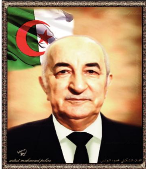
الدامس ينبتق نور الجزائر الحبيبة ودعمها السنخي يمد يد العون بـ 30 مليون دولار. أنه مشهد مليء بالحب

في ميادين العزة والكرامة والإباء يعضي حراس الأمة بقيادة الرئيس عبد المجيد تبون حفظه الله ورعاه يقدمون الخير وهم الأبطال المخلصين حيث مقارعة المستعمرين في كل مكان ليبلقوا بركب الجزائر الثائرة العظيمة .. الجزائر التي أصبحت قبيلة الأحرار والشرفاء في هذا الكون بالعباءة والبطولات في كل الميادين . ولا يفتوتني هنا أن أتقدم بالشكر للصحافة الجزائرية التي لم تترك فرصة إلا وذهبت إلى خطر الصهيونية ، وشذت الهمم للدفاع عن فلسطين ، وحذرت الأمة من التهاون في صد المحتلين الغزاة الذين جاؤوا من وراء البحار شكرا سيادة الرئيس عبد المجيد تبون شكرا للجزائر شعبا وحكومة حفظ الله الجزائر الحبيبة وتقول ، كيف نشقى من حب الجزائر