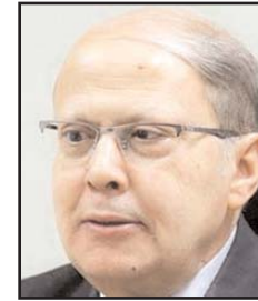
بقلم: عبد الحليم قتدليل