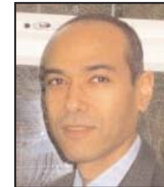
بقلم: مالك التركلي

المسلِّمة التي ينسبني عليها النظام الاقتصادي العالمي السائد اليوم هي أن السوق بنت الطبيعة وأن الرأسمالية من طبائع الأشياء. إلا أن هذا النظام الذي صار مسلطاً على جميع البشر في مختلف البلدان، غنياً وفقيراً، لم ينبت فطرياً في الطبيعة سداً لفرغ هي تركه، ولا هو نشأ بفعل قوى لا شخصية يحركها ما يسمى مكر التاريخ، وما يسميه هيغل بمزيد الدقة «خداع العقل في التاريخ». هذا النظام الاقتصادي، نظام الرأسمالية المتوحشة، لم ينشأ صدفة خارج إرادة البشر، ولم يظهر خفية خلف ظهور وكلاء الفعل الاجتماعي. بل الحقيقة أن هذا النظام، الجامع لشروط القلق الفردي والشقاوة الإنسانية في كثير من المجتمعات، إنما هو نتيجة لقرارات سياسية لا تزال تنجرم توجهات إيديولوجية نيوليبرالية طغت وهيمنت، وقد كانت هذه التوجهات أنغلو ساكسونية في الأصل، ولكنها أخذت تعمم منذ أوائل التسعينيات على بقية العالم. ورغم أن التسمية التي أطلقت على