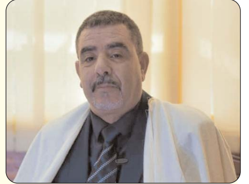
■ الشاعر نور الدين العدوالي - الجزائر

إلى ابنتي وصديقاتها، وإلى من درّسها، وأشرف عليها، وناقش مذكرة تخرجها. إلى طلبتنا وطالباتنا في يوم نجاحهم. ألا يا رفاق الدرب هذي بُنيتي زرعتم ثراها بالجمال فأبتعا سقّيتهم بشهد العلم قلب صغيرتي ففأخ بقلبي كالرحيق وشعشعاً أنتم لها ذرب الحياة معارفاً فزادتم بربوب العارفين ترفعاً وسجّتمو بالسمت غصن خميلتي ففيا سعد من ربّي العقول وأبدعاً بعثت إليكم نور عيني وشمعتي لثرفي الثريا كالثجوم وتسطعاً صبرتم - أعيي جداً علو جبالكم - ويا حطّ صيف حين يلقي سميدعاً! وهل يبخل المجدود جمع وفوديه أليس بساح الصابرين ترعرعاً؟! أتيت وحلم العمر يدقّ خافقي أباً وسط زهر المونسات تمعاً أشد إلى نجم السماء مطامحي ومن يصب علماً لن يهون فيرجعاً ففيا من يرفون البنات عراشاً إلى بطير الغاليات لثقلها هُناك بأعلى المزن تبني حدائقاً لمن أترك الغايات علماً ومن وعى ألاً يا رفاق الدرب بلثم مقاعداً بجئات عدن كالمقام توضعاً زعاكم إلهي أئتما لم شملكم ودمتم بأعلى الرأس تاجاً مرصعاً ونلتم من الخبرات ما نال عابدي وما اصطفت شيخ في الصلاة وأزمعاً ويا كون هذي - في البنات - أميرتي ويا قوم إن البص مبي ترعرعاً وإن دموعي كم تزيد سعادتني فقمي لمن شق الطريق ومن سعى ألاً فامسجوا بالعفو صمغ جهودنا ولنا تهرأوا بالدمع حين تهمعاً ألاً فاعذبوا تقصير بطني إن أخطأت وكيف أراني بعد هذا مؤدعاً؟! سعيد ومن مثلي يُنايس طائرًا يجوزاء سرب للقطاف تجمعاً وإني - وحرفي ينثر الفجر بينكم - أمير على عرش القصيد ترعباً.