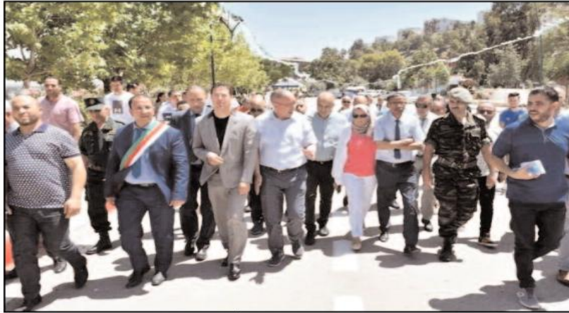
المساحات الخضراء بقسنطينة، وسيساهم هذا الإنجاز في استحداث ما يقارب 120 منصب شغل جديد 40 منهم دائمين، حسب ما تم إيضاحه.

تم، مؤخرا، تدشين حظيرة جديدة للتسلية والترفيه بحي الياسمين المتواجد بمنطقة عين الباي ببلدية قسنطينة من طرف الوالي، عبد الخالق صيوودة.