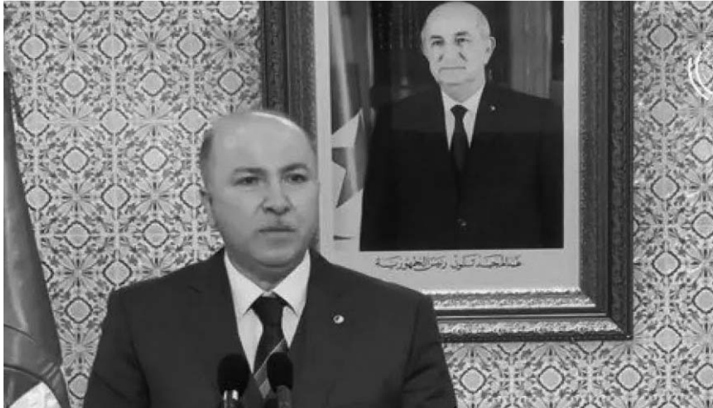
حيداوي يؤكد على أهمية العمل الجوّاري

أكد الوزير الأول، أيمن بن عبد الرحمان، يوم الخميس، أن ذكرى الـ05 جويلية يمثل "الفصل بين ماضٍ حكمنا فيه بالحديد والنار ومستقبل الاستقلال والحرية" وأن هذا التاريخ "يبقى في وجداننا هو المعلم والنهج والعنوان". بمناسبة الاحتفال بالذكرى الـ61 لعدي الاستقلال والشباب، كتب الوزير الأول على صفحته الرسمية في تويتر: "لنا في الذكرى الكثير من التضحيات والألام والأحزان،