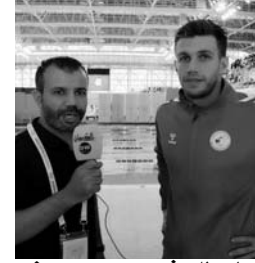
البطل شعوره بعد هذا الإنجاز؟

س / 1 / هنيئا إحرز 4 ميداليات في ثاني يوم من المنافسة، كيف يصف