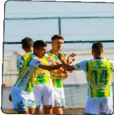
توقف وصيد الهلال عند 4 نقاط في المركز الأخير.