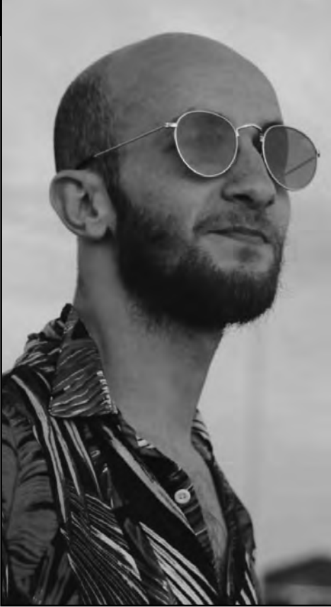
ومتوافرة على كل التطبيقات الموسيقية.