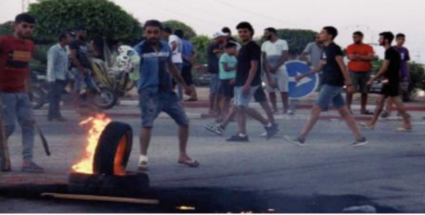
والمهاجرين بعد خطاب ألقاه الرئيس غير القانوني واعتبرها تهديداً للتركيبة قيس سعيد فيقيرابر الثالث انتقد فيه الهجرة الديموغرافية للبلاد.

تعرض عشرات المهاجرين من دول أفريقيا جنوب الصحراء إلى عمليات طرد من مدينة صفاقس التونسية والتي شهدت ليلة أخرى من العنف إثر مقتل أحد السكان في صدامات مع مهاجرين غير قانونيين، وفقاً لشهادات وصور تم بثها على الإنترنت.