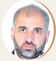
بقلم د. مصطفى يوسف اللداوي ص 9