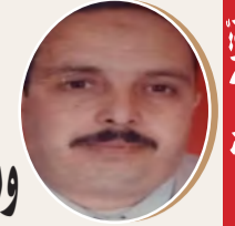
بقلم : سراي مسعود ص 8