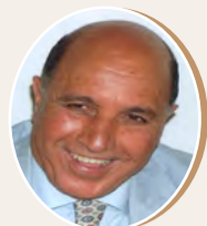
بقلم الباحث فؤاد بن طالب ص 8