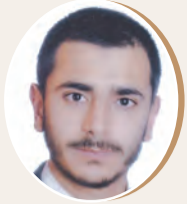
بقلم : ابراهيم ابو عواد ص 9