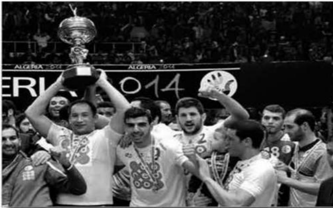
الطولة و التايكواندو و الكاراتي و الجمباز و الكرة الحديدية، كرة السلة و المصارعة.