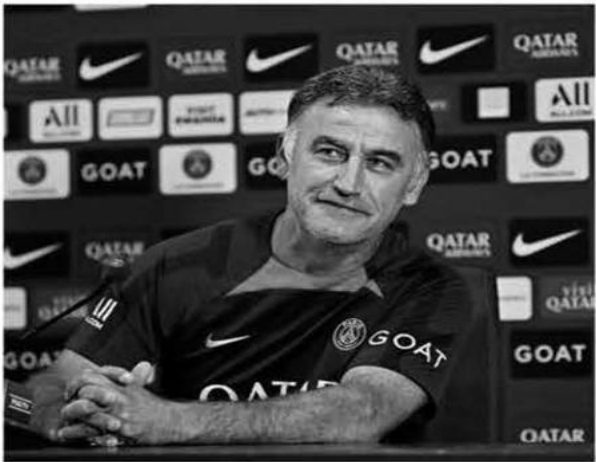
بات باريس سان جيرمان الفرنسي قريبًا للغاية من إعلان الانضمام رسميًا عن مدربه كريستوف غالتييه بعد موسم محبط للأمل، خاصة على الصعيد الأوروبي.

وحسب صحيفة "الكيب" الفرنسية، فإن باريس سان جيرمان وغالتييه على بُعد خطوة واحدة فقط من إعلان الانضمام رسميًا بعد عام من تولى البالغ من العمر (56) عامًا مهمة تدريب النادي الفرنسي. وعاش باريس سان جيرمان موسمًا محبطًا مع غالتييه، بعد الخروج المبكر من مسابقة دوري أبطال أوروبا، وتحديدًا من الدور الثاني على يد بايرن ميونخ الألماني. ولم تتوقف أزمات المدرب الفرنسي عند هذا الحد، حيث يواجه أزمة قضائية حادة بعد الكشف عن فضيحة عصرية تسبب بها في أثناء عمله في نيس الفرنسي. ورسدت الجهات القانونية بريدًا إلكترونيًا لغالتييه، شن فيه هجومًا لاذعًا على لاعبي فريقه بالقول: "أنا أدرب فريقًا من السود الذين يذهبون للصلاة كل يوم جمعة". ومن المتوقع أن يعلن باريس سان جيرمان فور التخلص من غالتييه، تعاقده مع الإسباني لويس إنريكي، مدرب منتخب إسبانيا السابق، والذي لم يدرّب أي فريق منذ الخروج المبكر للماتادور من موندفال قطر 2022. جدير بالذكر أن هناك ثورة تنتشر أروقة باريس سان جيرمان بعد رحيل النجمين ليونيل ميسي وسيرخيو راموس، والغموض الذي يسقط على مستقبل نيمار جونيور وكيليان مبابي.