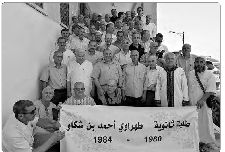
طلبة ثانوية طهراوي أحمد بن شكاو 1984 - 1984

أن ينتقل اللقاء بين الزملاء من المواقع إلى الواقع، وقد تجسد ذلك بفضل مجهودات العديد من الزملاء، الذين احتضنوا الفكرة. كانت محطة اللقاء فرصة لتبادل المعلومات والأفكار، معبرين اللقاء أرضية اللقاءات أخرى مستقبلا، تكون أكثر تنظيميا وحضورا للزملاء، الذين تعذر عليهم المشاركة، كما ترجموا على بعض الزملاء الذين توفروا، وآخرين هم في حالة مرضية منعتهم من التواصل وحضور اللقاء.