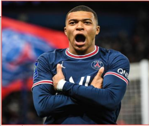
باريس سان جيرمان في 43 مباراة وتنجح في تسجيل 41 هدفا وصناعة خلال الموسم المنتهني 2022-23، 10 أهداف أخرى.