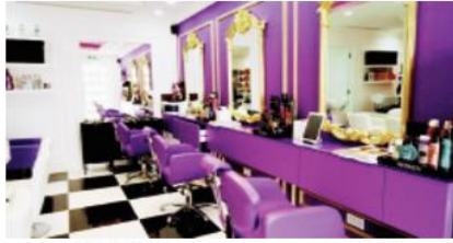
ج:٢ وأفاد بيان لوزارة التجارة أمس، أن العملية جاءت في إطار متابعة مراقبة قاعات الحلاقة والتجميل للنساء، لاسيما فيما يتعلق باللجوء إلى تقديم خدمات تكتسي الطابع الطبي (الحجامة، العلاج بالليزر، تبييض الأسنان)، مما يخالف أحكام القرار الوزاري المشترك المؤرخ في 31 جويلية 2017 الذي يحدد تعليمات الأمن الخاصة بالمطابقة في قاعات الحلاقة و/أو التجميل.

تمكن أحوان المراقبة التابعين لوزارة التجارة وترقية الصادرات من حجز كمية من المنتجات متمثلة في مواد التجميل غير مطابقة ومنتهية الصلاحية، مواد صيدلانية وشبه صيدلانية (حقن، إبروخ، برووتين، كيراتين، كولاجين، وسيرومات للحقن متوتمة) تقدر بـ 33 لتر و 18 كغ من مواد التجميل غير مطابقة و/أو منتهية الصلاحية، بقيمة 200.630 دينار.