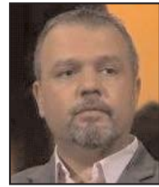
بقلم: خالدون الشيخ

خطف المواهب في عز عطائها، لأن غالبية النجوم الذي يتم جذبهم إلى السعودية هم من الذين تخطوا حاجز الثلاثين، والذين شارفت مسيرتهم على نهايتها، رغم بعض الاستثناءات، على غرار روبن نيفيش ابن الثامنة والعشرين، كما أيضاً ما زال ميكراً الحديث عن ضم الدوري السعودي لأفضل نجوم العالم في مقبل أعمارهم على غرار مبابي (24 عاماً) أو هالاند (22 عاماً) أو بيلنغهام (19 عاماً).