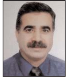
بقلم: نabil السهلي

وزيادة الطلب على المياه، من المقدر أن ترتفع نسبة العجز المائي الإسرائيلي لتصل إلى مليار متر مكعب سنوياً، وبالتالي ستبذل إسرائيل عن خيارات للسيطرة على مصادر مائة عربية لتلبية حاجاتها المائية. وتبعاً للسياسات المائية الإسرائيلية بات شبح العطش والجوع يلوح في الأفق بين الفلسطينيين، في وقت أدارت فيه إسرائيل ظهرها لكافة القرارات والاتفاقيات الدولية وفي المقدمة منها اتفاقية جنيف لعام 1949، ونتيجة لذلك بات المستعمر الإسرائيلي في الضفة الغربية يستهلك ستة أضعاف ما يستهلكه المواطن الفلسطيني صاحب الأرض.