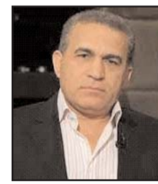
بقلم: سليمان جودة

نفك هذا اللغز الضخم المسمى تمرد جماعة فاغنر. وإذا كنا قد قرأنا أن بريغوجين طار إلى بيلاروسيا، وفق صفقة سياسية معلنة، وأن عناصر مجموعته عادت إلى ثكناتها، وإذا كانت الدنيا هدأت قليلاً، على ما يبدو أمامنا، فقد يكون وراء هذا الهدوء ما وراءه، تماماً كما كان وراء رأس الجبل العائم في حالة تيتانك ما وراءه في قاع المحيط.