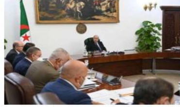
تليق بصورة وسعة الجزائر. العمل على توسيع استعمال الألبان البصرية مع نهاية 2024.