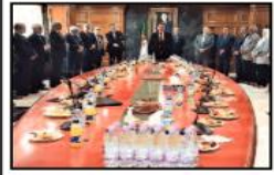
«شرف وزير الطاقة والمناجم، محمد عراقاب، أمس على حفل استقبال على شرف إطارات القطاع، وذلك بمناسبة عيد الأضحى المبارك».

بحضور الرؤساء المرءاء العامون لكل من مجعي سونطراك وسونارام ويمثل الرئيس المدير العام لجميع سونغاز ومحافظ الطاقة الذرية، وكذا رؤساء كل من سلطة ضبط المحروقات، لجنة ضبط الكهرباء، والغاز والوكالة الوطنية للنشاطات المنجمية، والوكالة الوطنية لتنشيم موارد المحروقات، بالإضافة إلى إطارات من الوزارة.