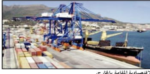
«قامت الوكالة الوطنية لترقية التجارة الخارجية «ألجكس» على مدار سنة 2022 بالعديد من الأنشطة وسجّدت جملة من الإجراءات لدعم ومرافقة المصدرين وتسهيل نشاطهم للولوج للأسواق الخارجية».

«قامت الوكالة في هذا الإطار بتطوير المنصة الرقمية «المصدرين الجزائريون» ALGERIA EXPORTERS التي تتيح للمصدرين الجزائريين التعرف بشركتهم والترويج لمنتجاتهم مع خلق فرص أعمال مع المتعاملين الأجانب، حيث تم تسجيل 183 مصدر في المنصة، وفق حصيلة الوكالة التي أفادت أنه تم كذلك «تلقّي 400 طلب للتسجيل في هذه المنصة الإلكترونية للمصدرين الجزائريين خلال سنة 2022»، يصيف المصدر ذاته. كما نظمت الوكالة وأطرت المشاركة الجزائرية في معارض عامة ومتخصصة أقيمت بالخارج بكل من فرنسا وألمانيا وروسيا وتركيا بالإضافة إلى تنظيم عدد من المظاهرات الماثلة على المستوى الوطني كعروض الجزائر للتصدير بقصر المعاصرة وتظاهرة أسبهار بتمتراس وكذا اليوم الدراسي حول تصدير التمور في مقر الوكالة، ناهيك عن تعزيز التعاون مع وكالات دعم التصدير عبر عدة دول عبر العالم. ◆