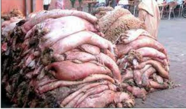
مسي تعين هذه التروة من خلال اتباع بعض الشروط من بلاء مع وضع الملح على المساحة اللينة من الجلد وتركه في ذلك الحرص على سلامة الجلد عند السلق وتجيب غسله المكان المخصص له.