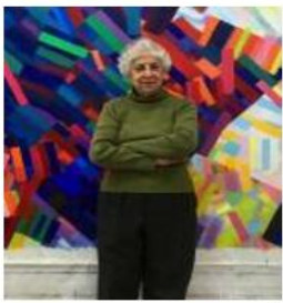
ألوان منسهرة ومتجانسة

كانت الفنانة الفلسطينية أول امرأة تشغل منصب أساذ مشارك في كلية للفنون، كما درست في جامعات هاراي والديانا وميشغان وغيرها. ورغم أن حلي التي صمها مجلة «أريانا برس» ضمن قائمة أقوى سة امرأة عربية (2014 - 2018) تركت أشغالها على التجريد، إلا أنها استحدثت أيضا أسلوبا وثائقيا للرسم التصويري. خاصة في أعمالها ذات الطابع الوطني مثل «سلسلة كفر قاسم»، و«صمت العذرات من المصنعات والأفلام التي تاتصف الحرب، وقدمت مساهمات في مجال الرسم الوثيقي، لتحميد العالمة التي يكابدها الفلسطينيون والذكير بحفهم في العودة إلى الوطن.